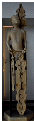
Artur SZOLDRA Żeglarz gwiazd