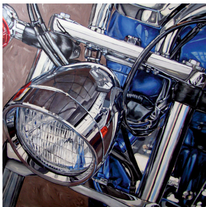
Angelika CZYREK Engine sound 01