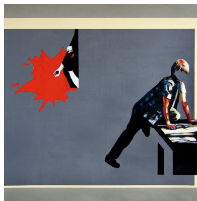
Krzysztof MUSIAŁ Stół